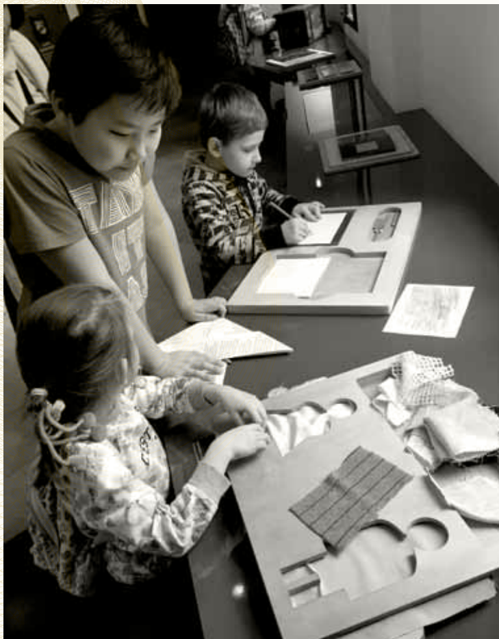
Děti migrantů a Čechů na výletě v rámci projektu Člověk člověku IV.