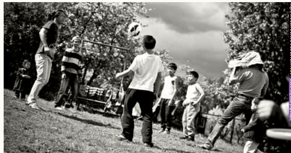
VÝROČNÍ ZPRÁVA 2016 ORGANIZACE PRO POMOČ UPRCHLÍKŮM

V roce 2016 právníci OPU poskytovali pravidelné poradenství v Centru na podporu integrace cizinců v Českých Budějovicích. Centrum je provozováno Správou uprchlických zařízení ministerstva vnitra ČR. Právnička OPU do centra vyjížděla ve frekvenci 1x týdně a poskytovala zde právní poradenství klientům z řad migrantů ze zemí mimo EU. Poradenství se týkalo zejména agendy zákona o pobytu, pracovního práva či rodinného práva.